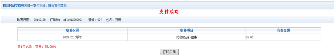
图 3.4-8 支付成功