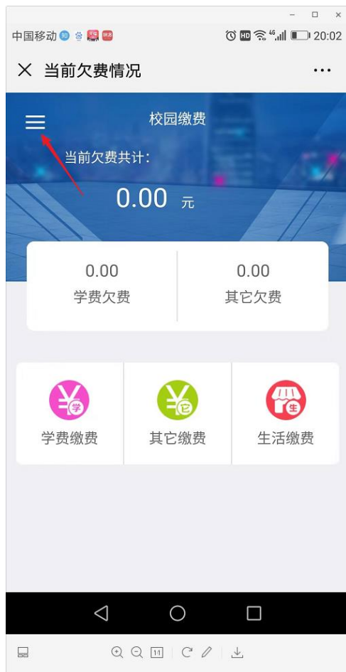
图7 支付平台主页面