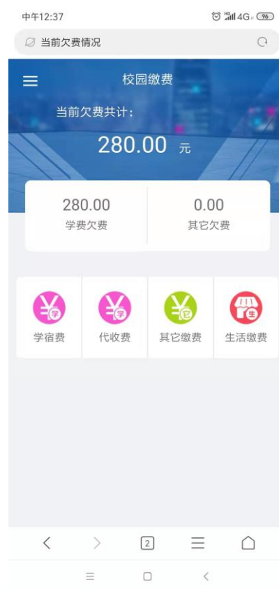
图 4 学费缴费页面