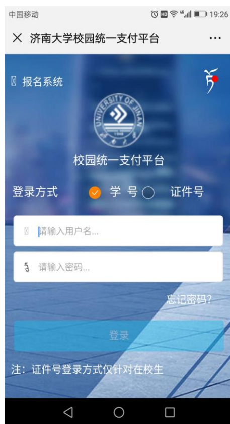
图 3 统一支付平台登录页面

2. 依次点击智慧济大“微信企业号中”“济大缴费”-“学费缴费”，或者点击济南大学计划财务处微信公众号中“在线缴费”菜单，都可以进入济南大学统一支付平台登录页面。在登录页面输入学号及密码（初始密码为身份证号后六位，末尾字母大写，无身份证信息的初始密码 6 个 0）。（图 3）