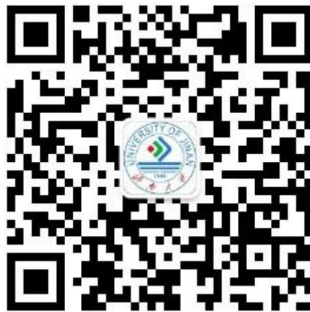
图 2 济南大学计划财务处微信公众号二维码

2. 依次点击智慧济大“微信企业号中”“济大缴费”-“学费缴费”，或者点击济南大学计划财务处微信公众号中“在线缴费”菜单，都可以进入济南大学统一支付平台登录页面。在登录页面输入学号及密码（初始密码为身份证号后六位，末尾字母大写，无身份证信息的初始密码 6 个 0）。（图 3）