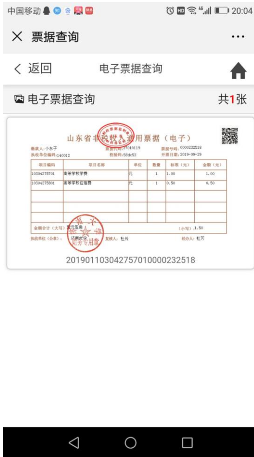
图 11 生成电子票据。