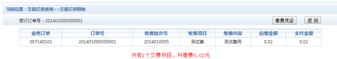
图 3.5-2 交易记录明细