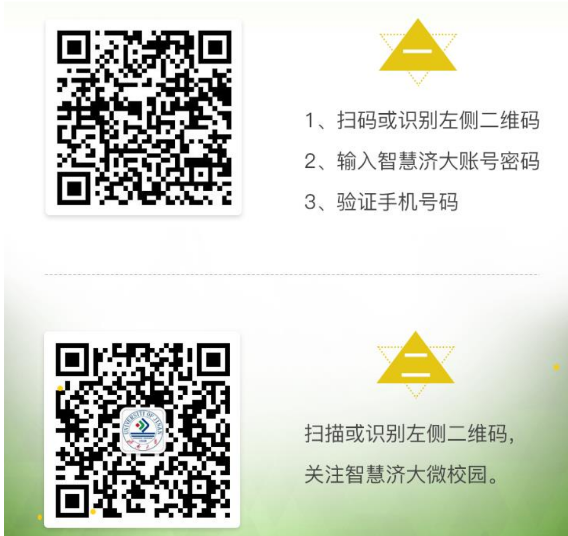
图 1 智慧济大微信企业号关注方式

1、手机微信端首先需关注“智慧济大”微信企业号（图 1）或者关注“济南大学计划财务处”微信公众号（图 2）。