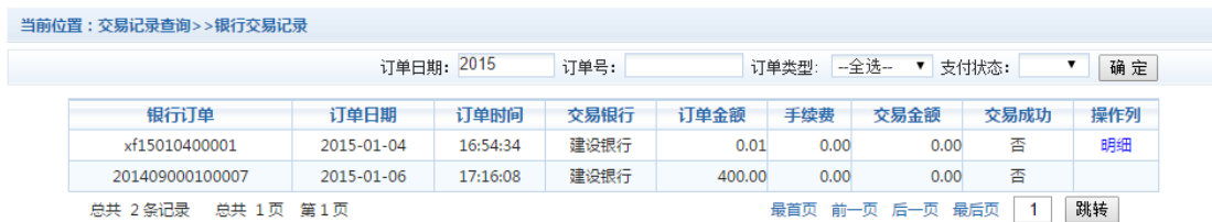
图 3.5-1 交易记录查询

点击导航栏的“交易记录查询”按钮，可以查询具体的银行交易记录。如图 3.5-1 所示。