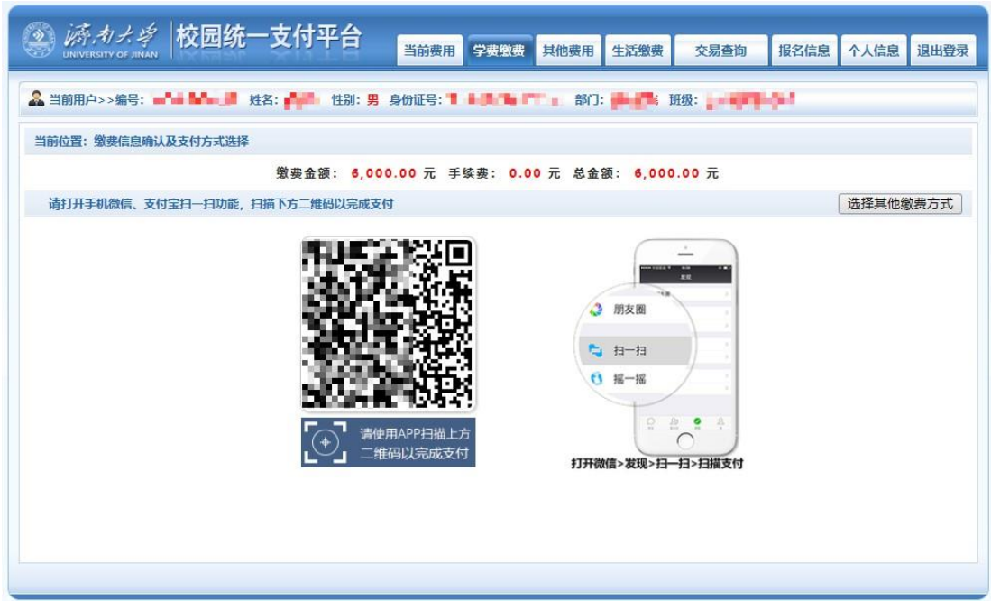
图 3.4-5 微信扫码支付