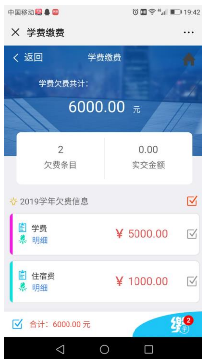
图 5 缴费页面