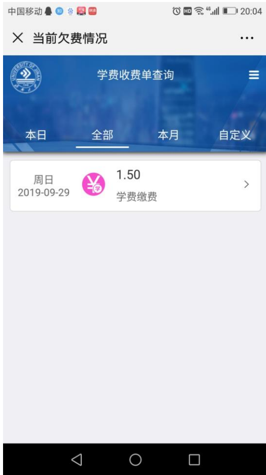
图 9 缴费明细