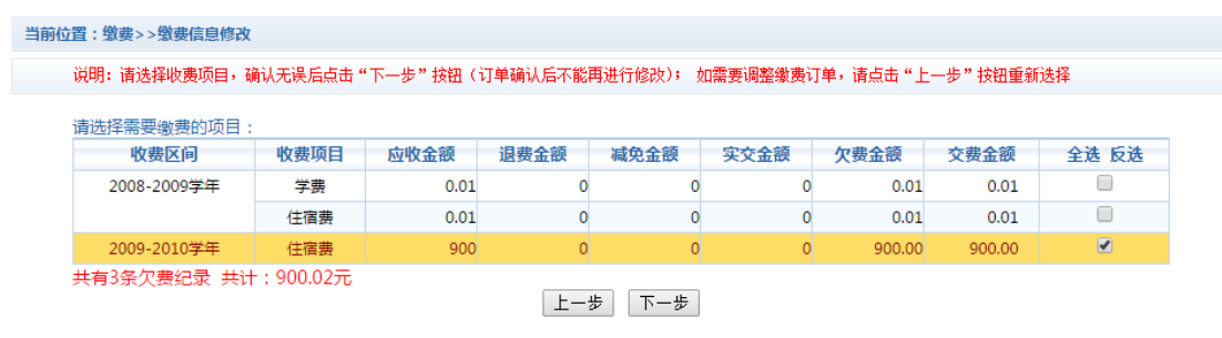
图 3.4-2 缴费项目选择