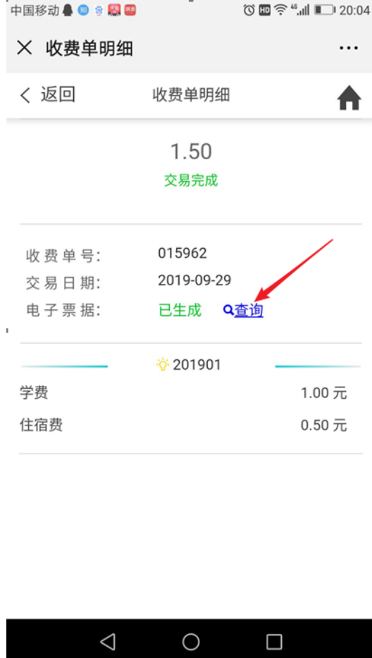
图 10 查询电子票据