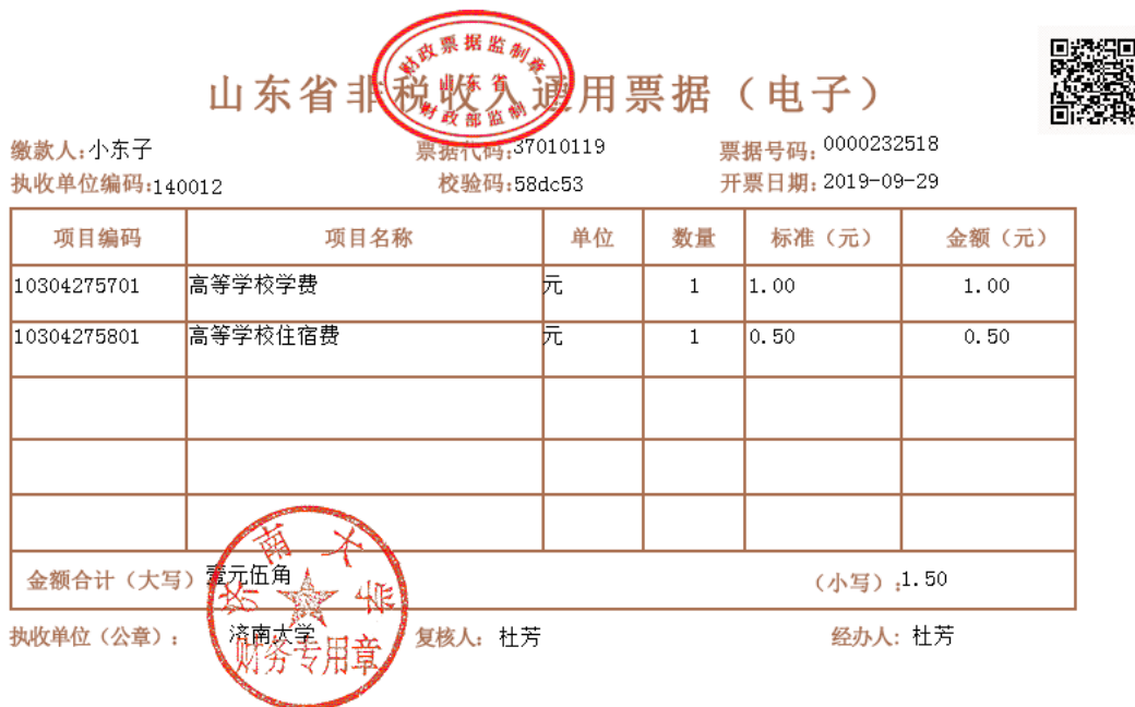
图 12 电子票据图片